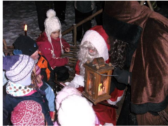
Zu Besuch bei einer Waldspielgruppe

Während der ganzen Chlaussaison stehen über 40 Freiwillige in den verschiedensten Funktionen im Einsatz und ermöglichen so 130 Chlausbesuche bei Familien, in Schulen und Kinderkrippen, in Altersheimen, bei Vereins- und Firmenanlässen. Insgesamt erhalten über 1000 Kinder und ebenso viele Erwachsene Besuch vom Samichlaus und seinem Schmutzli.