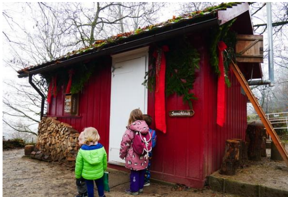
Chlaus-Hüsli im Bäumli (Goldenberg)

Damit die Chlaustage reibungslos ablaufen, arbeiten verschiedene Mitglieder und der Vorstand auch ausserhalb der Saison für die Chlausgesellschaft.